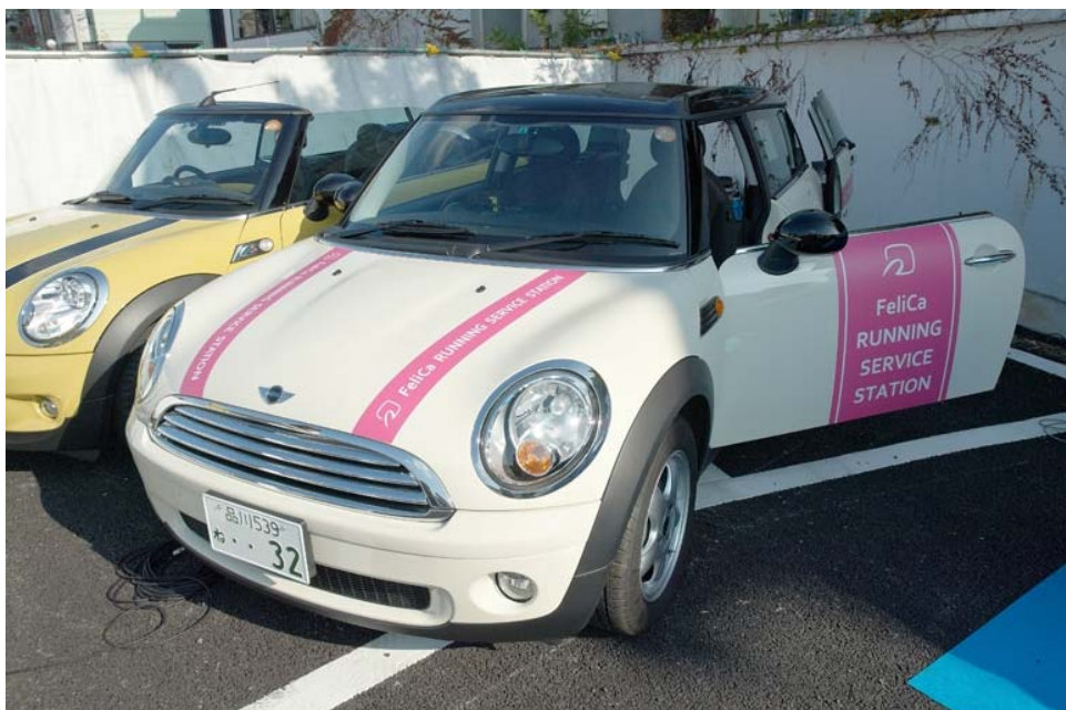
FeliCa RUNNING SERVICE STATION外観