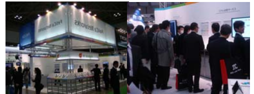
昨年のIC CARD WORLD 2011 フェリカネットワークスブース模様

会期 : 2012年3月6日(火)～9日(金) 開催時間 : 10:00～17:00 (最終日のみ16:30終了) 場所 : 東京国際展示場「東京ビックサイト」東2ホール ブースNo. : NF2202 URL : http://www.shopbiz.jp/nf/